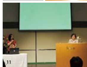
9. 丁如霞氏 10. 著書「丁家の人びと」 11. スライドを使い講演する丁如霞女史(右) 娘の蔣嬢氏が通訳