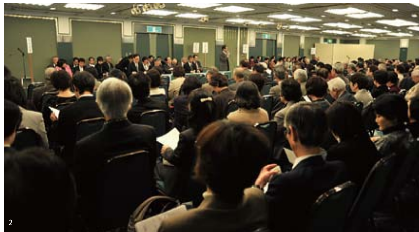
1. 総会に先立ち開催された理事会 2. 全国各地から参加の会員で埋まった総会

○八月二十一日～二十三日 第三回中央研究会・講演 「シルクロードの印章」(小田玉瑛先生)