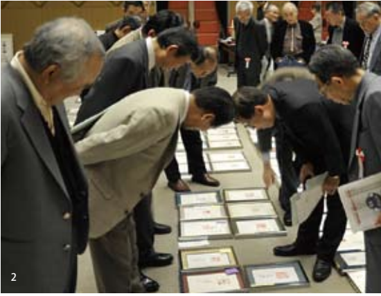
2. 慎重に審査に当たる審査員

第二十六 回日本篆 刻展の審査 会が三月 二十八日 大阪市 中央会館で 行われた。 理事以上 の役員を 除く二〇 二点を対 象に厳正 公平な審 査により 協会賞四 点、大賞 一点、準 大賞一 点、優秀 賞二六 点、奨励 賞九一 点、特選 二〇〇 点、秀作 賞一〇 六六 点、会 員推薦 賞八六 点が選 ばれた。